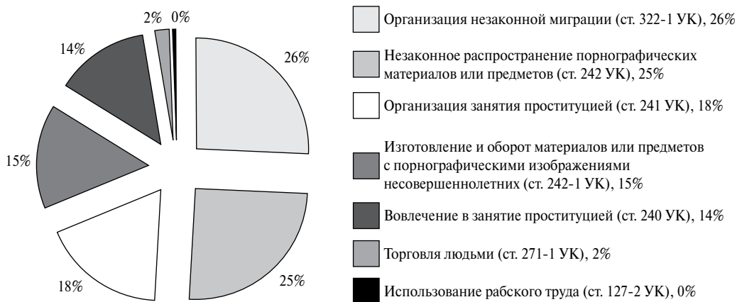
Рисунок 2 Структура зарегистрированных преступлений в сфере торговли людьми и организации незаконной миграции в 2012 г.

Источник: расчеты по данным Министерства внутренних дел Российской Федерации.